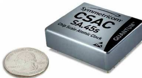
Външен вид на часовника

Американски изследователи са разработили най-малкия комерсиален атомен часовник. Известен е като SA.45s Chip Size Atomic Clock (CSAC) и може да бъде купен за само 1500 долара. Разработен първоначално за нуждите на военните, часовникът има размер на кибритена кутийка, маса около 35 грама и консумира мощност 115 mW. Създателите му твърдят, че той би могъл да има най-различни приложения – от деактивиране на бомби до търсене на петрол. Особено ценен е при работа в зони, където не достигат сигналите на GPS-системата (под водата, в минните галерии и др.п.).